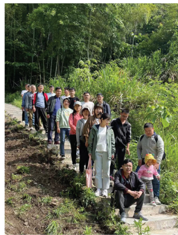
爬山就像人生一样，虽然有曲折、磨难，只要勇敢地去面对，就没有过不去的坎。